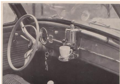
HERTELLA-Auto-Kaffeemaschine 40 Watt Stromverbrauch, einfach und handlich – auch für Tee, Brühe, heiße Zitrone usw. – im Handschuhfach stets griffbereit – wird einfach am Armaturenbrett eingehängt!

Существуют автомобильные кофемашины для личного использования